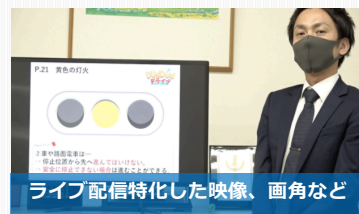
ライブ配信特化した映像、画角など